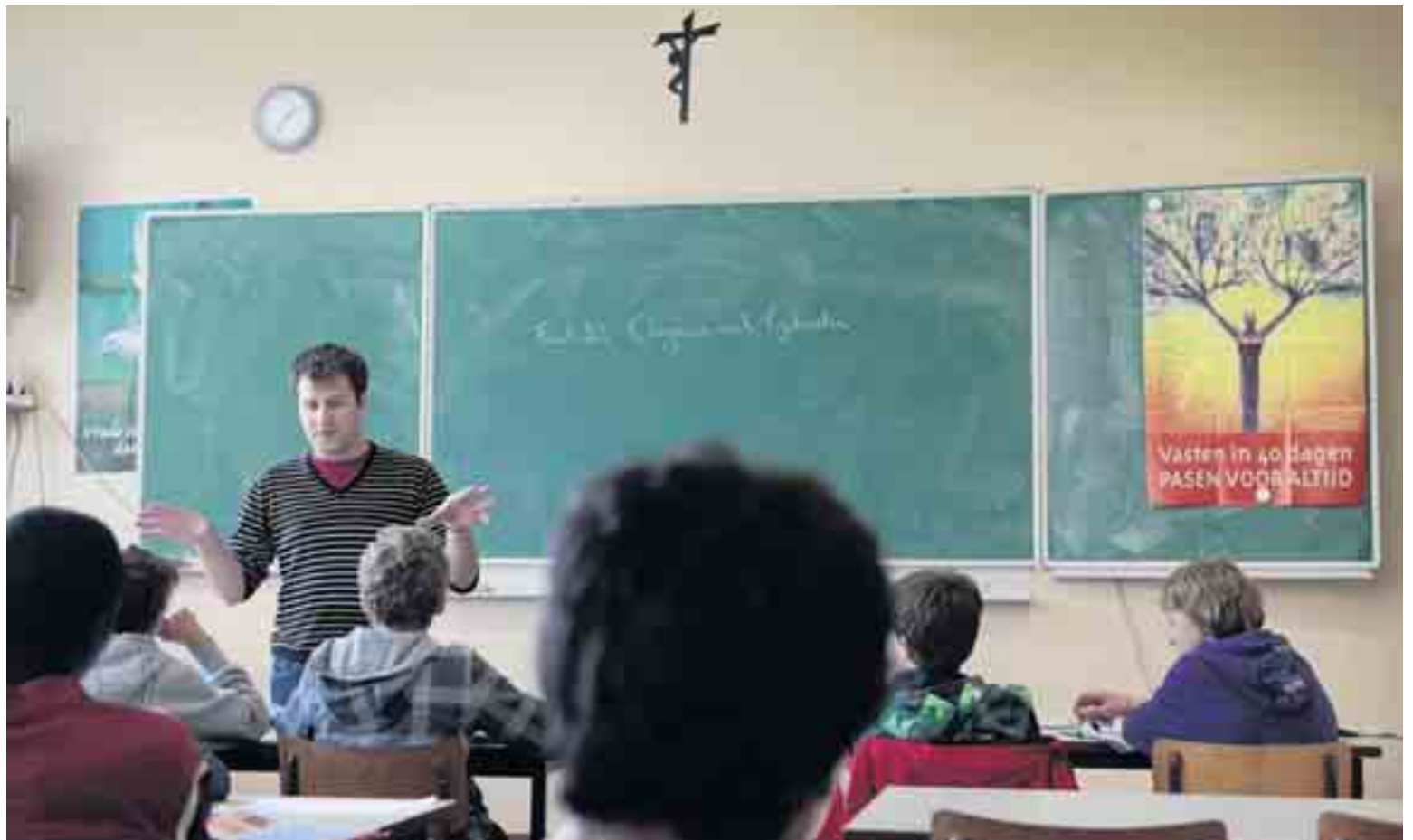
In het secundair onderwijs kiest één op de drie jonge leerkrachten al na een jaar voor een andere job.